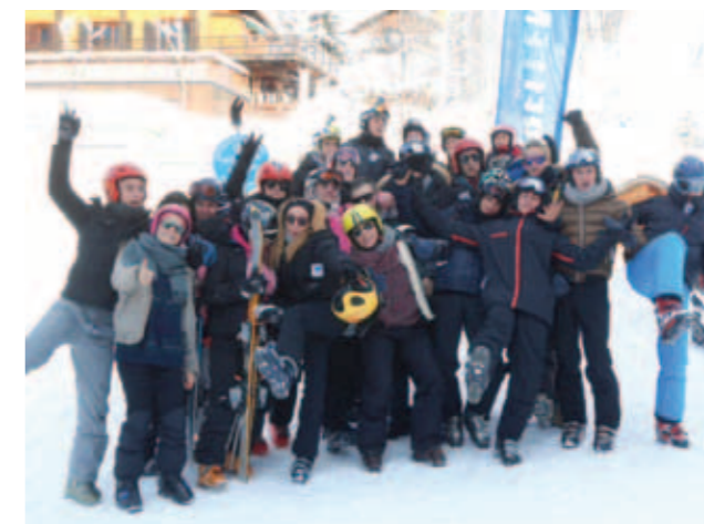
La classe de Première Pro Commerce

dans lequel les élèves ont pu partager le quotidien de jeunes handicapés moteurs ou mentaux, ce qui leur a beaucoup apporté. La leçon de vie que transmettent toujours ces personnes, quand on les côtoie, ne laisse jamais indifférent !