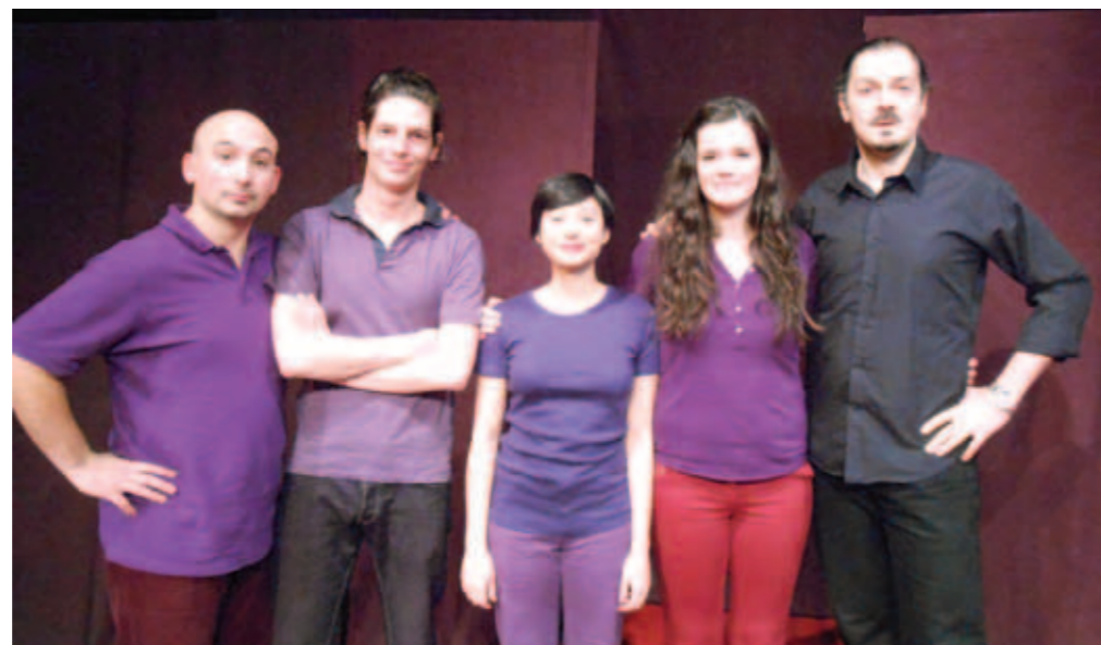
La troupe Entrées de jeu

Le public, des élèves de 1ère (sans intervention de professeur ou de surveillant, pour leur laisser toute liberté de parole) semble intéressé par cette formule nouvelle, et assiste donc à 5 pièces courtes, où le thème central est l'alcool, vécu par des jeunes dans différentes situations : une soirée arrosée, le retour (un peu difficile...), une fête de famille, ou même au lycée, juste avant le contrôle de maths après une ou deux bières bues pendant le déjeuner... Certaines situations ont probablement un goût de "déjà vu" ... De spectateurs, certains jeunes se prennent au jeu et deviennent acteurs ;